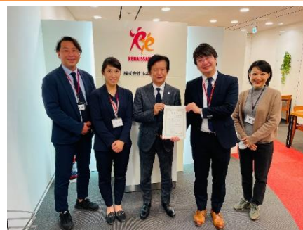
健康行動の優良組織をCHOが表彰