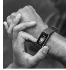
(画像左から ・FTX TRAINER ・ULTIMATE SANDBAG ・RAM BOX ・HR SENSOR)