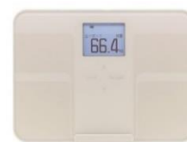
スマート体組成計2