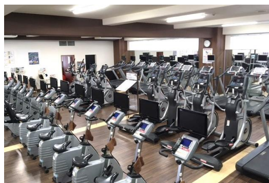
Lite！ルネサンス横浜 24 ジムエリア