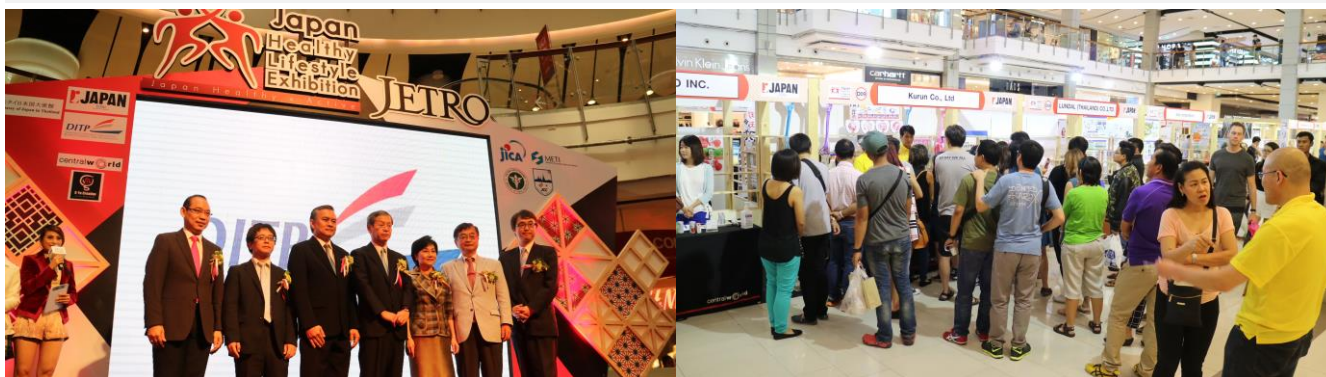
昨年開催された「健康長寿広報展 in タイ」(2016年3月5日～3月6日開催)

今年で4回目を迎える「健康長寿広報展」、「健康長寿＝日本」のイメージ定着を図るため、今回はベトナム・ハノイで開催。海外展開を考えている診断・健康管理分野、スポーツ&レクリエーション分野等、健康関連製品やサービスを提供する企業が多く出展します。