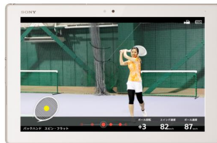
※UI画面は開発中で、変更になる可能性があります。