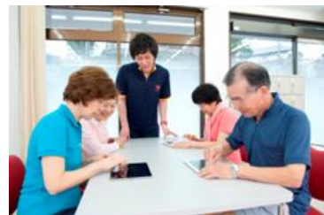
iPad を使ったコミュニケーション