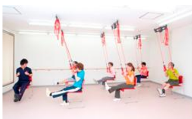
レッドコード・トレーニング

また、利用の様子や変化などを画像でわかりやすく伝える御家族向けの通信サービスを行います。