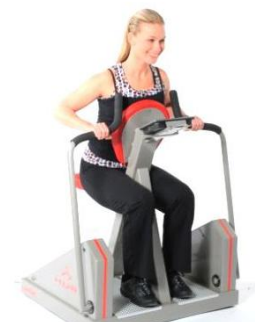
最新の空圧式マシン

リハビリテーション施設での使用にも適した機能を備え、利用者の方に緊張感・不安感・威圧感を与えないデザインの空圧式マシンを使用しての機能改善を実施します。また、歩行訓練用平行棒・ウォーカー・エルゴメーターを設置し歩く機能を向上させます。