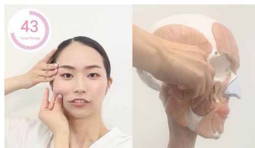
フェイスナルトリートメント