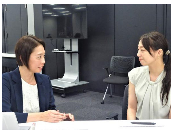
メンターとメンティーの顔合わせ