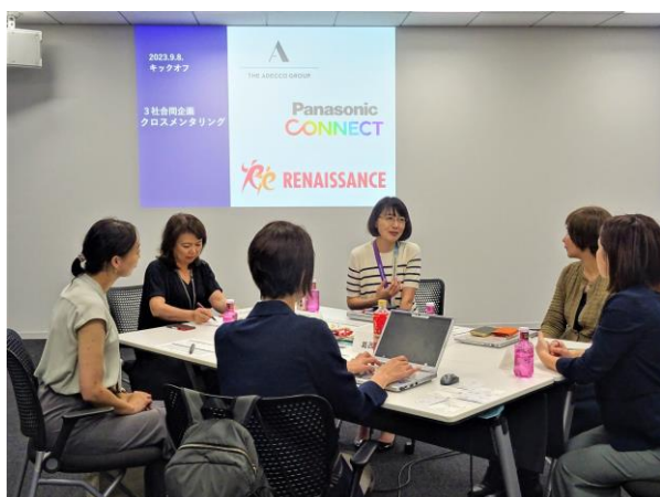
グループでディスカッション